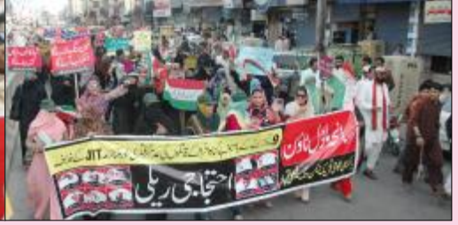
فیصل آباد: سانحہ ماڈل ٹاؤن کو 9 ماہ گزرنے اور انصاف نہ ملنے پر پُر زور احتجاج