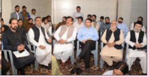
پاکستان عوامی تحریک کے زیر اہتمام آل پاکستان ورکرز کنونشن